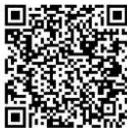
แบบสอบถามความพึงพอใจของผู้ประกอบการ โครงการอาหารเสริม (นม) โรงเรียน ปีการศึกษา ๒๕๖๔

กองเลขานุการคณะกรรมการโคนมและผลิตภัณฑ์นม ได้จัดทำแบบสอบถามความพึงพอใจของผู้ประกอบการที่เข้าร่วมโครงการอาหารเสริม (นม) โรงเรียน ทั้งหมดจำนวน ๙๐ ราย โดยให้ผู้ประกอบการดังกล่าวตอบแบบสอบถามผ่าน QR Code ซึ่งมีผู้ประกอบการที่ตอบแบบสอบถาม ตามตารางดังต่อไปนี้