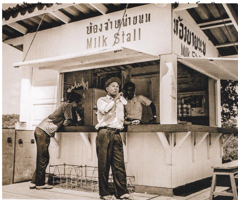
ห้องจำหน่ายนมแห่งแรกบริเวณหน้าฟาร์มโคนมไทย – เดนมาร์ค

ปี พ.ศ. 2508 - จัดซื้อเครื่องพาสเจอร์ไรส์ ผลิตนมบรรจุขวด ปิดผนึกด้วยฟลอปอล์ย [FOIL] ขนาดบรรจุ 200, 500 และ 1,000 ซี.ซี. (นำน้ำนมดิบผ่านการกรอง และฆ่าเชื้อ ด้วยกรรมวิธี PASTURIZATION ที่อุณหภูมิ 65 – 70 °C เป็นเวลา 30 นาที)