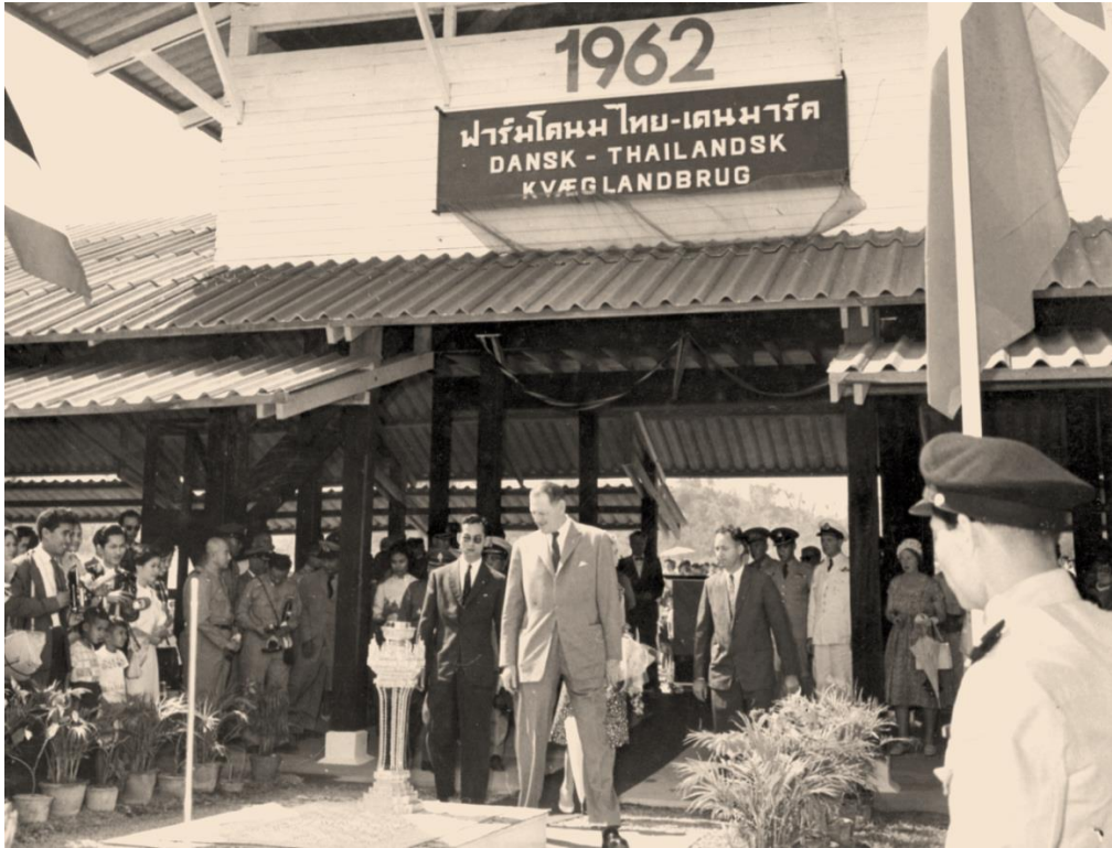
พระราชพิธีเปิดฟาร์มโคนมไทย – เดนมาร์ค โดยพระมหากษัตริย์ไทย และ เดนมาร์ค