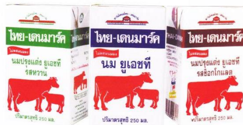
นม ยู.เอช.ที. บรรจุกล่องสี่เหลี่ยม รายแรก ของประเทศไทย